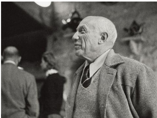
Vallauris, Pablo Picasso, 1954