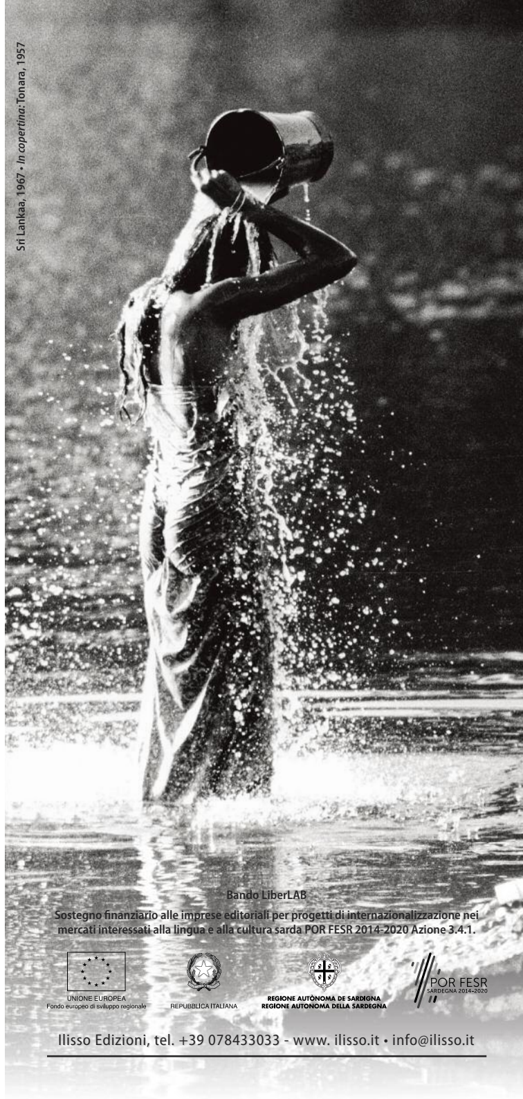
Sri Lanka, 1967 • In copertina: Tonara, 1957