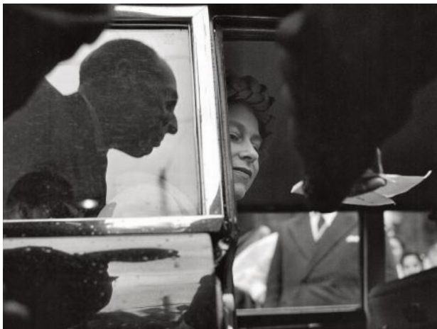
Cagliari, arrivo in città della regina Elisabetta II d'Inghilterra, 1961